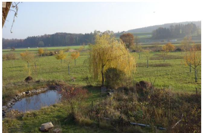
Foto oben links: 12. August - oben rechts: 4. September – unten links: 1. November - unten rechts: 4. November