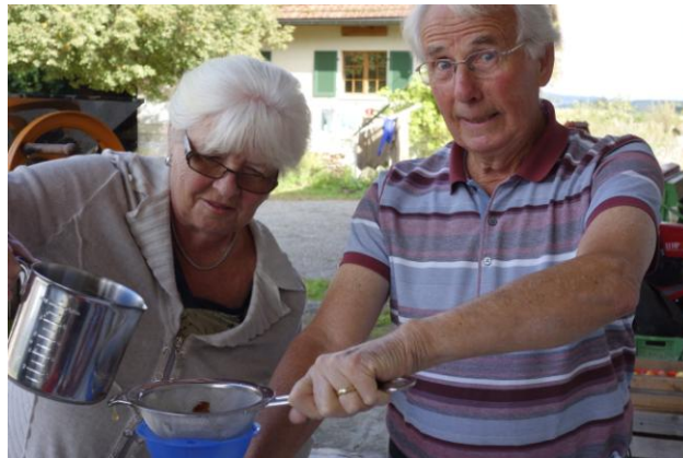
Fritz mit Fritz